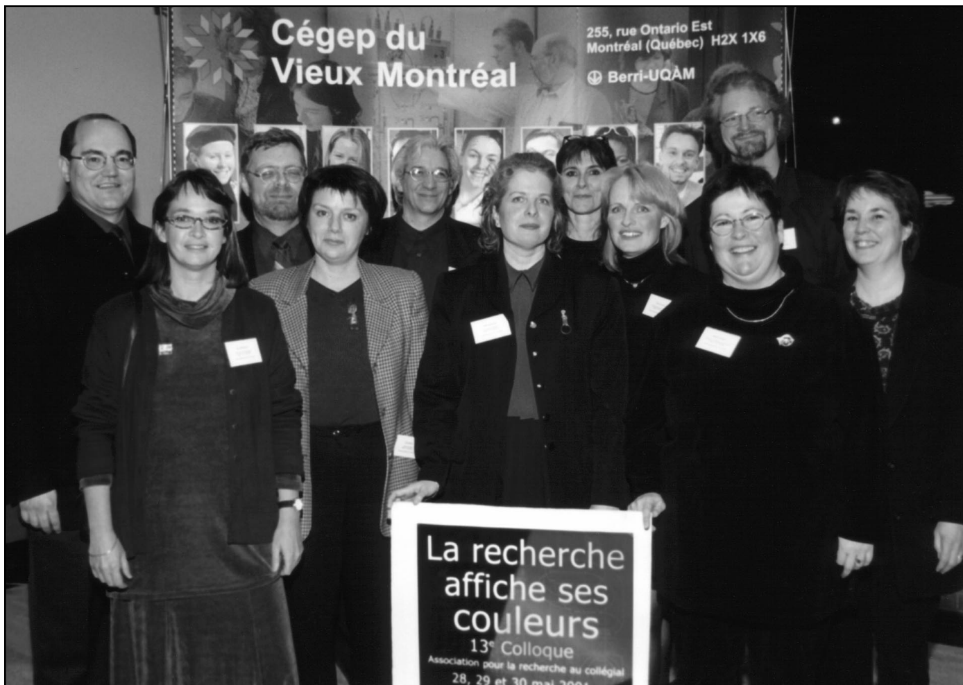
Le comité organisateur du 13 e Colloque de l'ARC

A u printemps de ce nouveau millénaire, l'ARC est fière d'afficher ses couleurs ainsi que celles des chercheuses et chercheurs qu'elle regroupe. Ces couleurs témoignent de la diversité des travaux réalisés de même que de la fierté éprouvée de la part de celles et de ceux qui font vivre la recherche à l'ordre collégial, la font également rejaillir sur l'ensemble du réseau, voire de la société. Chaudes, ces couleurs brûlent et laissent des traces au-delà des seules actrices et